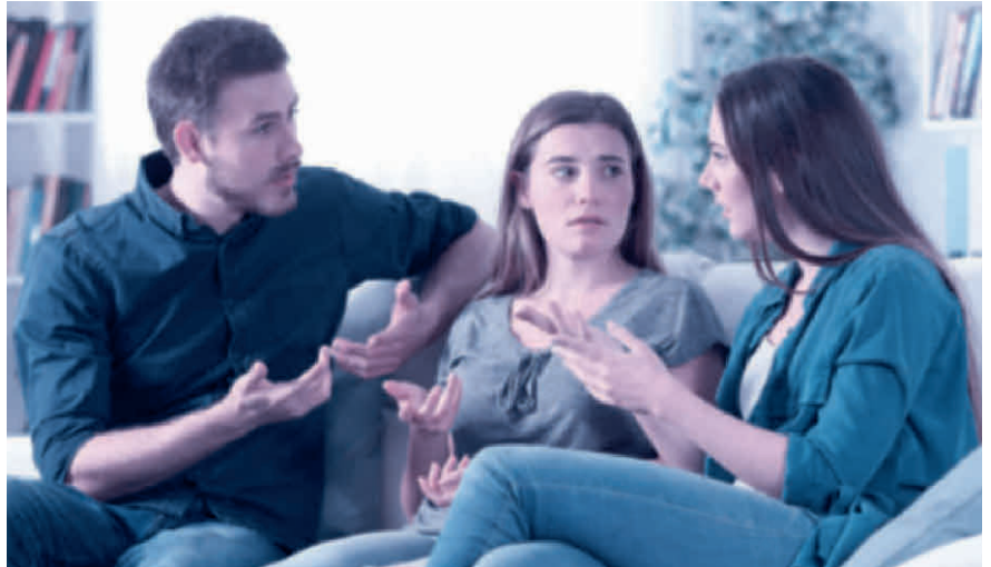
Kommt es zum Streit zwischen den Erben, muss der Willensvollstrecker schlichten.

Der Willensvollstrecker setzt den letzten Willen des Erblassers um. Dafür stellt er als Erstes ein Inventar auf, das er laufend nachführt. Er verwaltet die Erbschaft bis zur Teilung und muss darauf achten, dass das Vermögen erhalten bleibt. Er bezahlt die Schulden des Erblassers inklusive der Todesfallkosten und treibt offene Forderungen ein. Zur Verwaltung gehören auch die laufenden Geschäfte, beispielsweise muss er sich um den Unterhalt von Liegenschaften kümmern, laufende Verträge kündigen oder allenfalls die Liquidation einer Einzelunternehmung umsetzen. Er ist verantwortlich für die Erstellung der