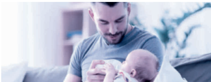
Vaterschaftsurlaub: innert sechs Monaten nach der Geburt zu beziehen.

Das Unternehmen muss dem Vater zehn arbeitsfreie Tage gewähren und hat für diese Zeit Anspruch auf 14 Taggelder. Es ist Sache des Arbeitgebers, bei der Ausgleichskasse – welche auch die EO-Beiträge abrechnet – den Antrag auf die Vaterschaftsentschädigung zu stellen. Der Antrag sollte aber erst gestellt werden, wenn der Arbeitnehmer den ganzen Vaterschaftsurlaub bezogen hat und der Arbeitgeber dies mit dem Antrag bestätigen kann. Die Auszahlung der Vaterschaftsentschädigung erfolgt dann nachgelagert